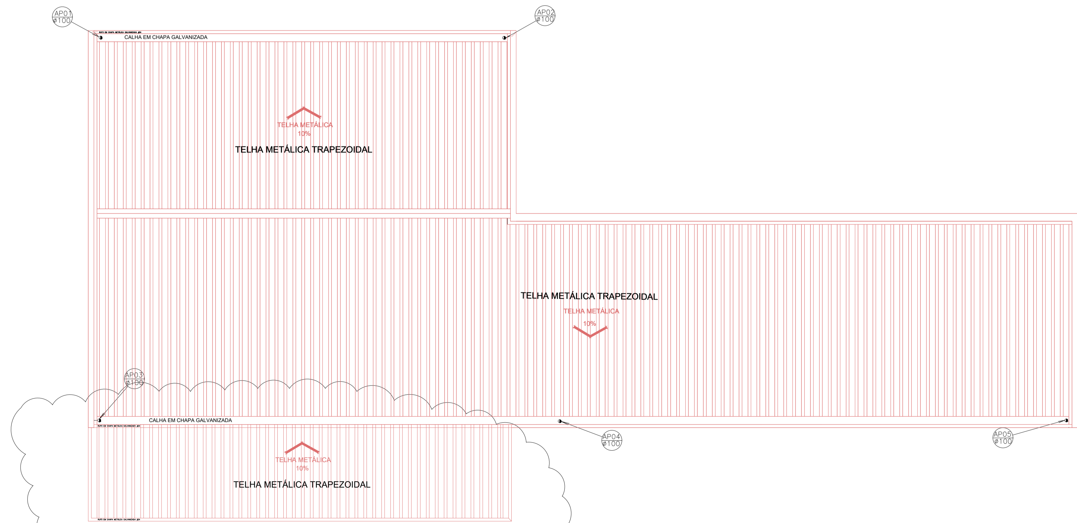
PLANTA DE COBERTURA - DEPÓSITO E MANUTENÇÃO ESCALA 1:100